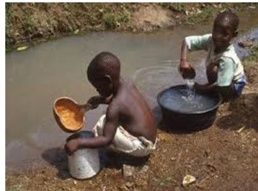
Children collecting water. By ED