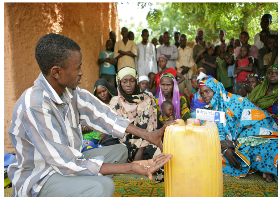
Sensitization on use of aquatabs for water, Niger. By Pirozz